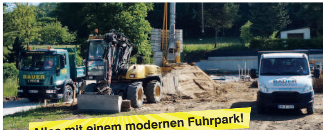
Alles mit einem modernen Fuhrpark!